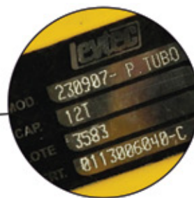
Etiqueta metálica com rastreabilidade